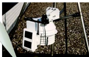
regen meten volgens de richtlijnen ombouwset 7440-WV met beugel om regenmeter op de grond te plaatsen